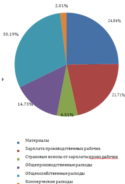
Рисунок 1- Структура калькуляции себестоимости

Оптовую цену изделия ( \Pi_{\text{оп}} ) рассчитать по формуле (22):